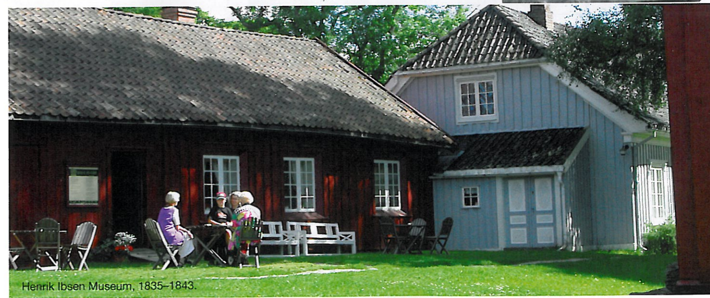
Henrik Ibsen Museum, 1835-1843.