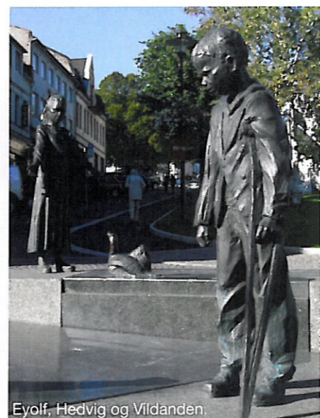
Eyolf, Hedvig og Vildanden.

But even so, there are traces of Henrik Ibsen all over town.