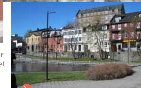
Den særpregede bebyggelsen i Hjellen minner om miljøer i flere av Europas havnebyer.

Fra Laugstol park. I år 2000 feiret vi Skiens første 1000 år med blant annet kongelig besøk på Tusenårsstedet – Skiens vannfront og Telemarkskanalen.