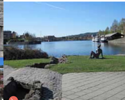
Laugstol park. Stedet har også tilnavnet "Lille-helvete", antakelig fordi tømmeret ofte floket seg til i fossen som lå her.