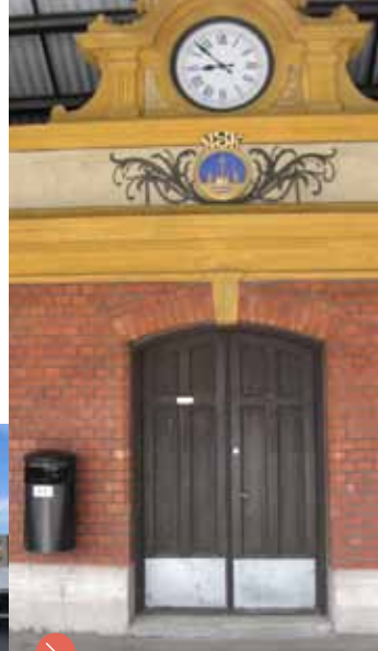
Ekspedisjonsbygning for Telemarkskanalen tegnet av arkitekt Haldor Børve.

Marit Benthe Norheims skulptur "Rottejomfruen" er dekorert med 2349 øyne laget av skolebarn fra Skien.