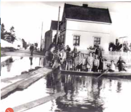
Flom på Bakkestranda i 1927.

Bakkestranda med påler - «røtterane» - ute i vannet. Tømmerbunter ble festet til dem i påvente av videre transport ned til Union papirfabrikk.